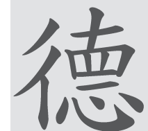
De – die Tugend

Impulse geben statt Gängel, individuelle Erfahrungsräume öffnen statt Leistungsdruck aufbauen – dies sind Ansätze von Taijiquan- und Qigong-LehrerInnen, die SchülerInnen in ihrer Menschenwürde und ihrem Selbstbestimmungsrecht achten.